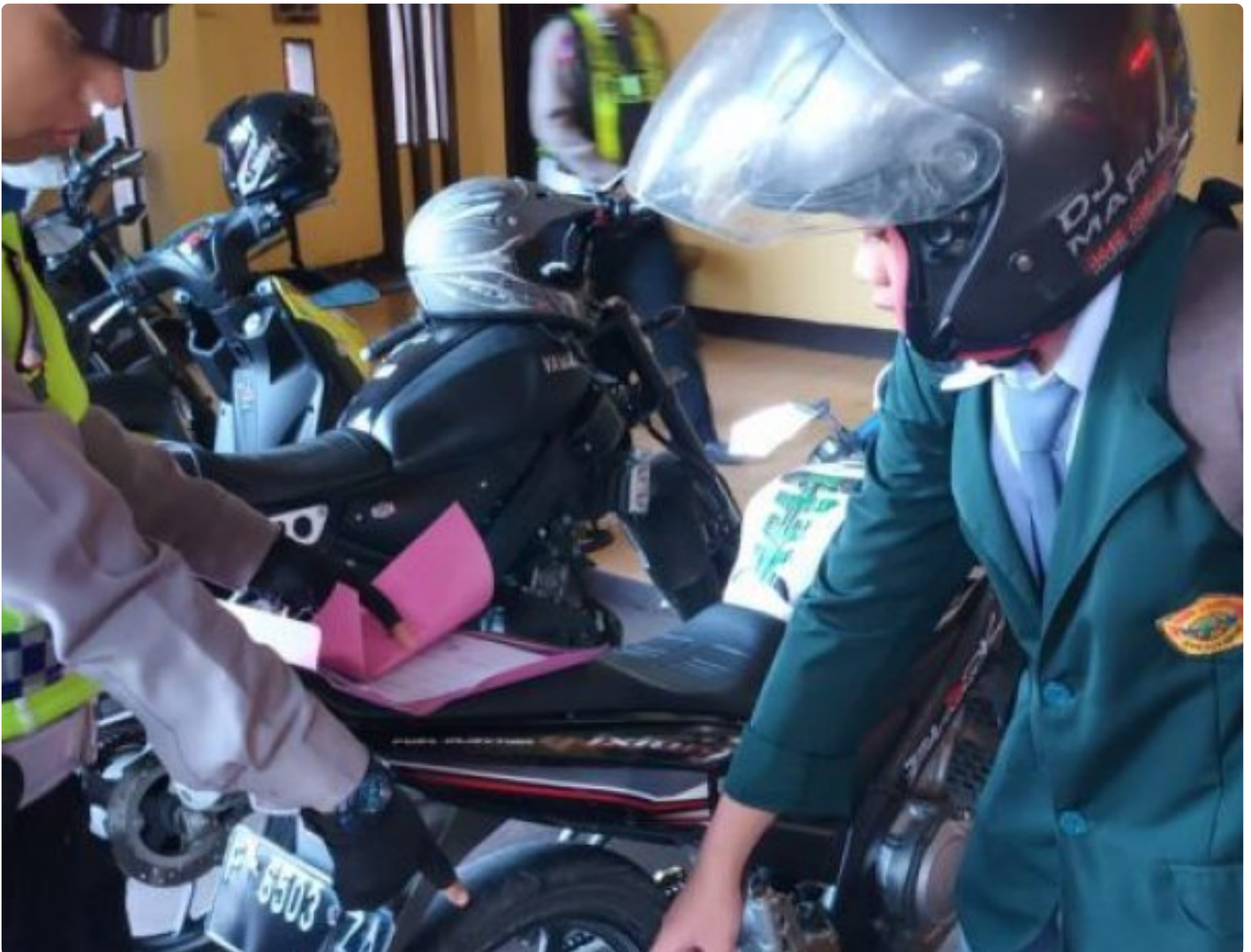
Polsek Cisaat Polres Sukabumi Kota

Kota Sukabumi – Polres Sukabumi Kota Polda Jawa Barat – Unit Lalulintas Polsek Cisaat Polres Sukabumi Kota setiap hari, melaksanakan sosialisasi dan penertiban knalpot brong atau knalpot tidak sesuai dengan spesifikasi Hal ini